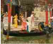
Nuovo record a € 137.200 per Rinaldo Giudici da Dorotheum