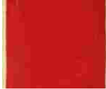
Un monocromo rosso di Mario Schifano in asta a Roma da Minerva