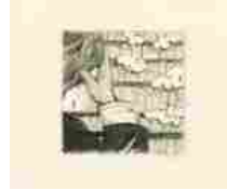
Tullio Pericoli, 'La casa ideale di Robert Louis Stevenson'