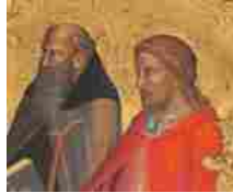
Galleria dell'Accademia di Firenze, nuove importanti acquisizioni