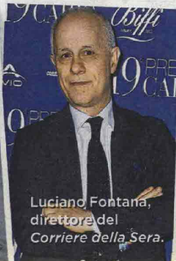
Luciano Fontana, direttore del Corriere della Sera.