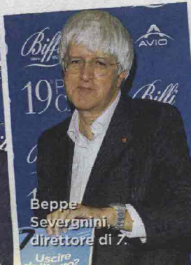
Beppe Severgnini, direttore di L'Espresso.