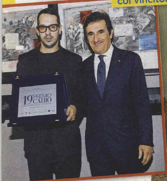
Foto ricordo col vincitore