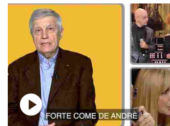
«Una storia da cantare» dedicata a De Andrè, quando gli spet...

La prima edizione del Premio Cairo si svolse il 26 ottobre del 2000 alla Posteria di