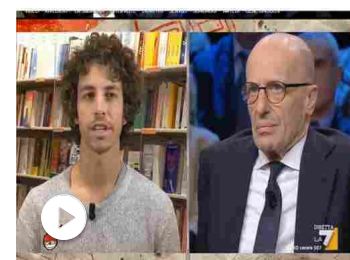
Il leader delle Sardine a La7: «Salvini male assoluto? Solo ...