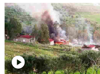
Barcellona Pozzo di Gotto, esplose fabbrica di fuochi d'arti...